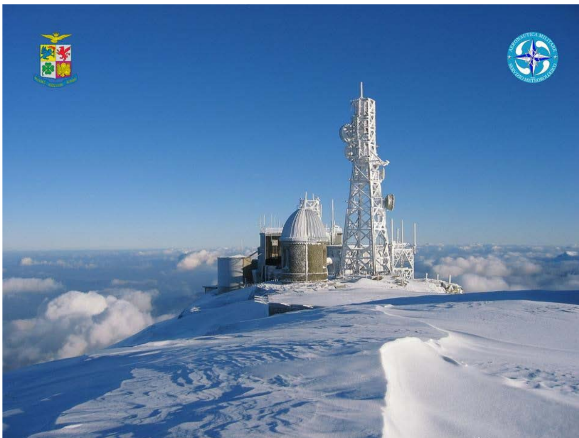
La Base Operativa del C.A.M.M. presso la vetta del Monte Cimone durante la stagione invernale.

Il Centro Aeronautica Militare di Montagna è un ente del Servizio Meteorologico dell'A.M. alle dirette dipendenze del Centro Nazionale di Meteorologia e Climatologia Aeronautica di Pratica di Mare. Il C.A.M.M. opera dal 1937 nel campo della meteorologia classica per l'assistenza alla navigazione aerea e per gli aspetti statistico-climatologici e previsionistici; si occupa inoltre di telecomunicazioni, ma anche dello studio del clima e dell'ambiente. In particolare, il Centro è da decenni impegnato in importanti attività di monitoraggio ambientale. Situato in vetta al Monte Cimone, sull'Appennino modenese a 2165 m.s.l.m. e lontano da grandi centri urbani ed industriali, il C.A.M.M. è stato il primo in Europa ed il secondo al mondo ad effettuare misure di fondo di CO 2 atmosferica. In tema di monitoraggio di gas serra, il Centro ha di recente ampliato e migliorato la propria attività, con l'installazione di nuova strumentazione all'avanguardia in questo tipo di misure, riuscendo ad avviare, nel febbraio 2015, il monitoraggio di un altro importante gas ad effetto serra, il metano (CH 4 ). Il C.A.M.M. è altresì impegnato in misure di ozono colonnare e radiazione solare ultravioletta presso la sua base logistica, nel paese di Sestola (MO).