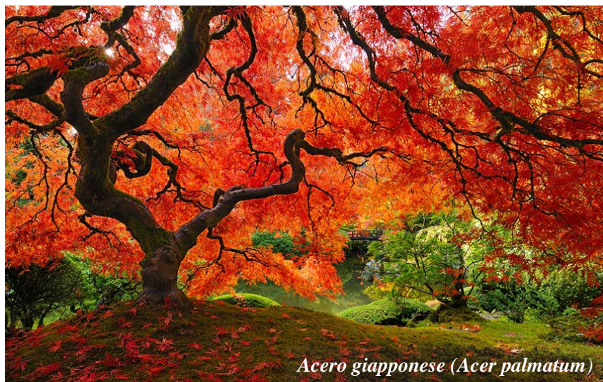
Acer giapponese (Acer palmatum)